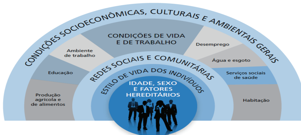
Figura 11: O modelo da determinação social da saúde de Dahlgren e Whitehead

2. Os fatores das camadas 1, 2 e 4 sofrem influência de políticas de saúde. Os fatores das camadas 3, 4 e 5 estão mais intimamente ligados a políticas sociais.