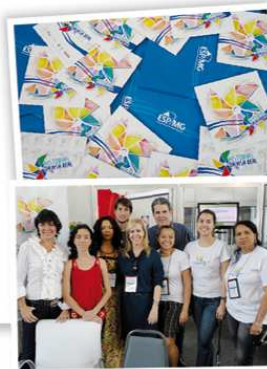
Equipe organizadora compareceu ao Encontro que lançou o E-book

Inspirado em uma experiência de gestão municipal em Sete Lagoas, Minas Gerais, o projeto Histórias da Visa Real é resultado de uma parceria entre o Centro Colaborador em Vigilância Sanitária do Nescon/UFMG e a Escola de Saúde Pública do Estado de Minas Gerais (ESP-MG) com o apoio da Agência Nacional de Vigilância Sanitária (Anvisa). A iniciativa, que teve o objetivo de reunir experiências vivenciadas pelos trabalhadores da área de Vigilância Sanitária, se transformou em um material multimídia lançado, nesta semana, durante o V Simpósio Brasileiro de Vigilância Sanitária (Simbravisa).