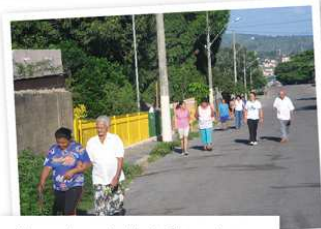
Alunos do município de Pitangui com o Grupo de caminhada para hipertensos

Inauguração da Unidade Geraldo Campos Valadão, destinada à educação profissional para o SUS. A Unidade conta com novos laboratórios; um Centro de Documentação e Informação, composto por mais de 1000 obras e cerca de 20 títulos de periódicos relacionados à educação em saúde, além de novas salas de aula.