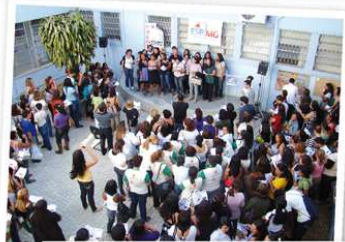
Paródias Agente Comunitário de Saúde