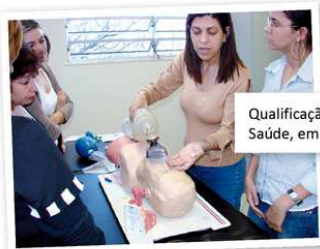
Qualificação em Urgência e Emergência para Rede Assistencial de Saúde, em parceria com a PBH