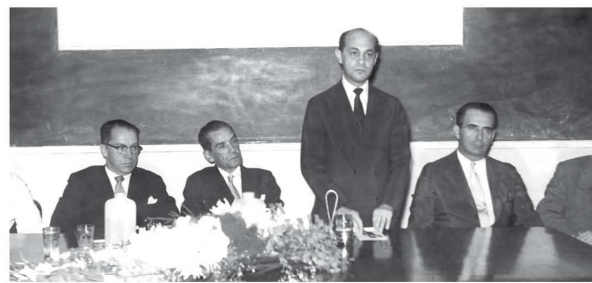
O então secretário de Estado de Finanças de Minas Gerais, Tancredo Neves - em pé - durante discurso de encerramento da Especialização em Saúde Pública, em 1959.

Livia Guimarães Zina, mestre e doutora em Odontologia Preventiva e Social, servidora da ESP-MG.