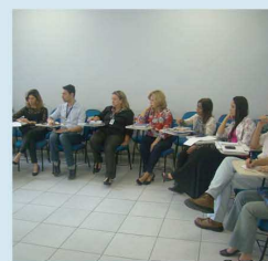
de Saúde Pública do Sistema Único de... (Leia Mais)

Pesquisadoras da ESP-MG e do Centro de Pesquisa René Rachou/Fiocruz Minas estiveram na comunidade indígena Xakriabá, em São João das