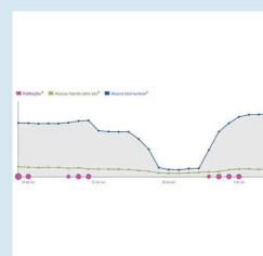
de quase 2 minutos por página... (Leia Mais)