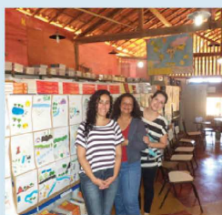
Missões, na região Norte do Estado, de 25 a... (Leia Mais)