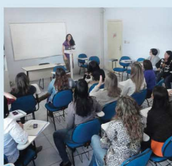
Missões, na região Norte do Estado, de 25 a... (Leia Mais)

O Comitê Gestor - Equipe Editorial e seus Editores Convidados e alguns dos Editores Associados e integrantes do Conselho Editorial da Revista