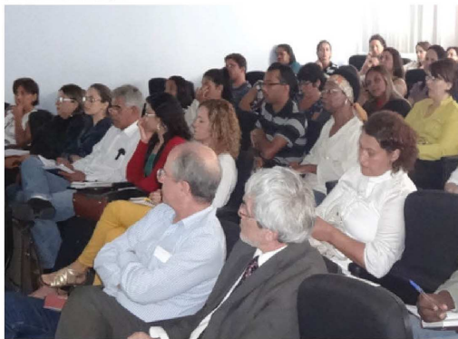
Profissionais de 40 municípios em evento na ESP-MG.

O quarto evento da série “Encontros ESP-MG 2013 Supervisão Clínica e Institucional em Saúde Mental” ocorreu ontem (30), no auditório da Escola de Saúde Pública (ESP-MG), com o tema “Supervisão na atenção básica e especializada”.