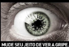
MUDE SEU JEITO DE VER A GRIPE.

Servidores da Escola de Saúde Pública do Estado de Minas Gerais (ESP-MG) participaram do 2º Congresso Brasileiro de Política, Planejamento e Gestão em Saúde, realizado no... (Leia Mais)