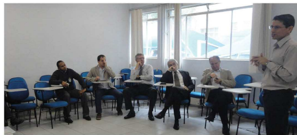
Gestores e técnicos participam de reunião.

No Brasil, a Coordenação Geral de Gestão do Conhecimento do Departamento de Ciência e Tecnologia (DECIT/SCTIE) do Ministério da Saúde, representa a Secretaria Executiva da EVIPNet Brasil com o objetivo geral de estabelecer mecanismos facilitadores da incorporação da produção de