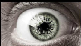
MUDE SEU JEITO DE VER A GRIPE.

Nos dias 29 e 30 de outubro será realizado, em Belo Horizonte, o Workshop Projeto Atenção Especializada em Doença Falciforme (PAE), promovido pelo Centro de Educação e Apoio para... (Leia Mais)