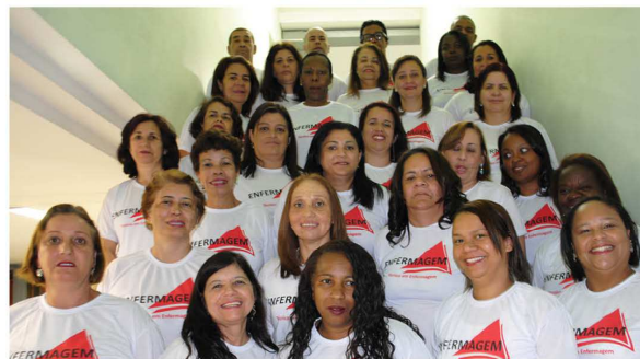
Alunos do curso Técnico em Enfermagem, turma G.

minha vida profissional, mesmo estando na área durante muito tempo, sempre temos coisas novas para aprender. São muitos desafios todos os dias, foi ótimo e enriquecedor, ampliou os horizontes de todos nós, acredito ser uma grande vitória a nossa formatura", declara a aluna.